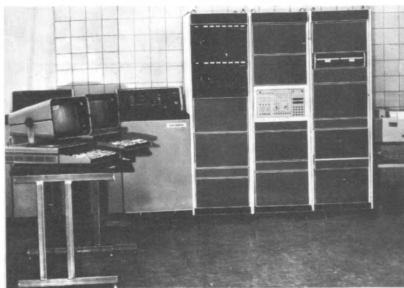
Рис. 2. Вычислительный комплекс «Электроника МС0002.04»

ЭВМ содержит три вида каналов передачи информации: единый, совместимый с интерфейсом "Общая шина" и содержащий 5 уровней запроса периферийными устройствами; массовой памяти (3 канала) для обмена информацией с внешними запоминающими устройствами на магнитных дисках и лентах; основной (оперативной) памяти.